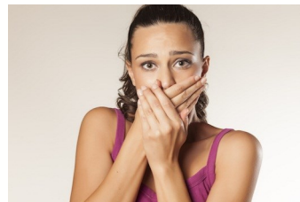
Zahnbelag verursacht Mundgeruch

Bakterien im Mund bilden schwefelhaltige Stoffe, die unangenehmen Mundgeruch verursachen können. Oft merken die Betroffenen gar nichts davon.