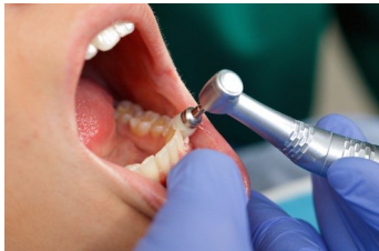
Politur der Zahnoberflächen

Bei der professionellen Zahnreinigung (PZR) werden diese Beläge von geschulten Fachkräften sanft und gründlich entfernt.