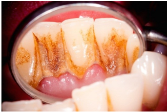
Zahnstein und Zahnbelag

Auch bei bester häuslicher Mundpflege bleiben Beläge auf den Zähnen zurück - vor allem in den Zahnzwischenräumen.