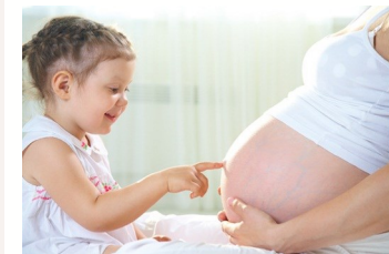
PZR während der Schwangerschaft?

Während einer Schwangerschaft ist das Zahnfleisch besonders empfindlich und kann sich leicht entzünden. Deshalb empfehlen wir: