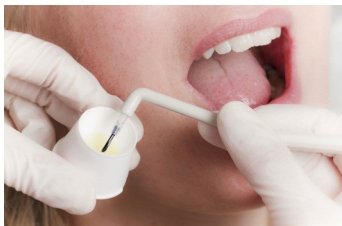
Zahnschmelzhärtung mit Fluorid

Anschließend werden die Zahnoberflächen poliert, weil sich auf glatten Oberflächen nicht so schnell neue Beläge festsetzen.