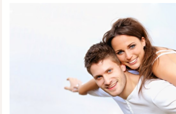
Kosten sparen. Leben genießen.

Wer seine Zähne mit guter Mundpflege und regelmäßiger PZR erhält, braucht keinen teuren Zahnersatz und keine Implantate.